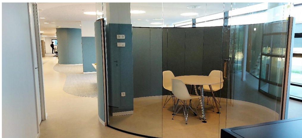
Revestimiento oficinas RNB (Valencia).