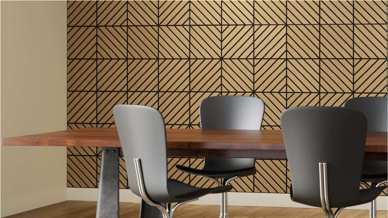
Mural revestido con paneles Singular 45.