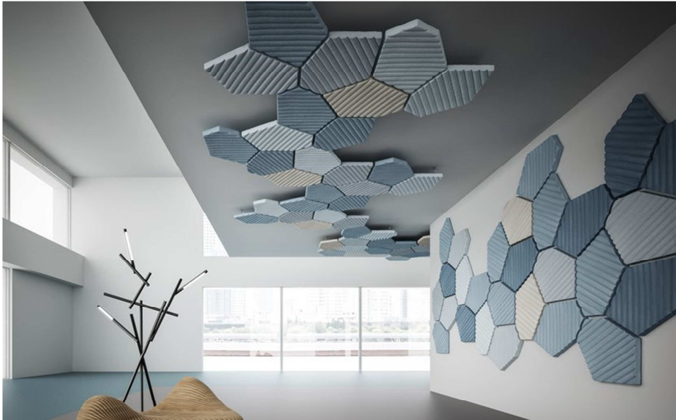
Paneles ranurados amorfos en techos y paredes.